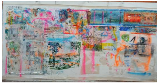
STUDIOLO 2 – FRANKOGRAFIE AUF LEINWAND 220 X 450

MALEN HAT AUCH EIN BISSCHEN WAS MIT ZAUBERN ZU TUN UND MIT „VERZAUBERN“ | KUNST ENTSTEHT NICHT AUS ANSTRENGUNG - EHER ABSICHTSLOS-MIT LUST | DER WETTSTREIT DES „ INNEREN BILDES“ MIT DEM „ÄUßEREN BILD“ IM SCHNITTPUNKT DES AUGES | HIER BEGINNT DAS DRAMA DES BILDERMACHENS – HADER UND STREIT | DAS CHAOS BEGINNT | DIESEN DREH DES INNEREN BILDES IM ÄUßEREN BILD IST DIE EIGENTLICHE LEISTUNG DER MALEREI - WENN'S DENN GELINGT!?